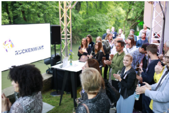
Fotos von der Jubiläumsfeier

150 Gäste feierten teilweise bis in die frühen Morgenstunden.